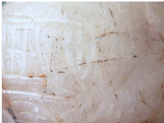
Détail du croc